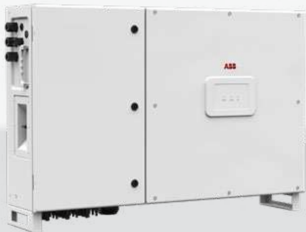
— Inversor de cadena PVS-50/60-TL

Esta nueva adición a la familia de inversores de cadena PVS, con 3 MPPT independientes y una potencia de hasta 60 kW, se ha diseñado para maximizar el retorno de la inversión en sistemas extensos, con todas las ventajas de las configuraciones descentralizadas, tanto en instalaciones montadas en suelo como en cubierta.