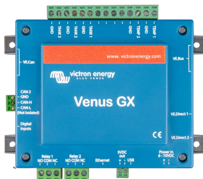
Venus GX con conectores