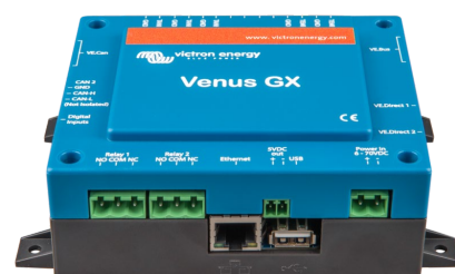
Ángulo frontal del Venus GX