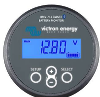
Detección de Bluetooth BMV-712 Smart Battery Monitor