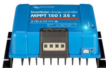
Controlador de carga SmartSolar MPPT 150/35