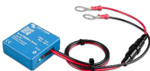
Detección de Bluetooth Smart Battery Sense