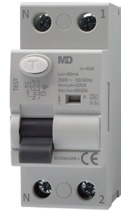
RCCB 2P Tipo A 30mA 40A