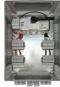
SPF 10/1-40/1000/15 (122)

Esta serie de protectores para sistemas fotovoltaicos tienen como finalidad proteger contra sobrecorrientes y sobretensiones producidas por impactos de rayos en la parte de continua de instalaciones generadoras de energía fotovoltaica.